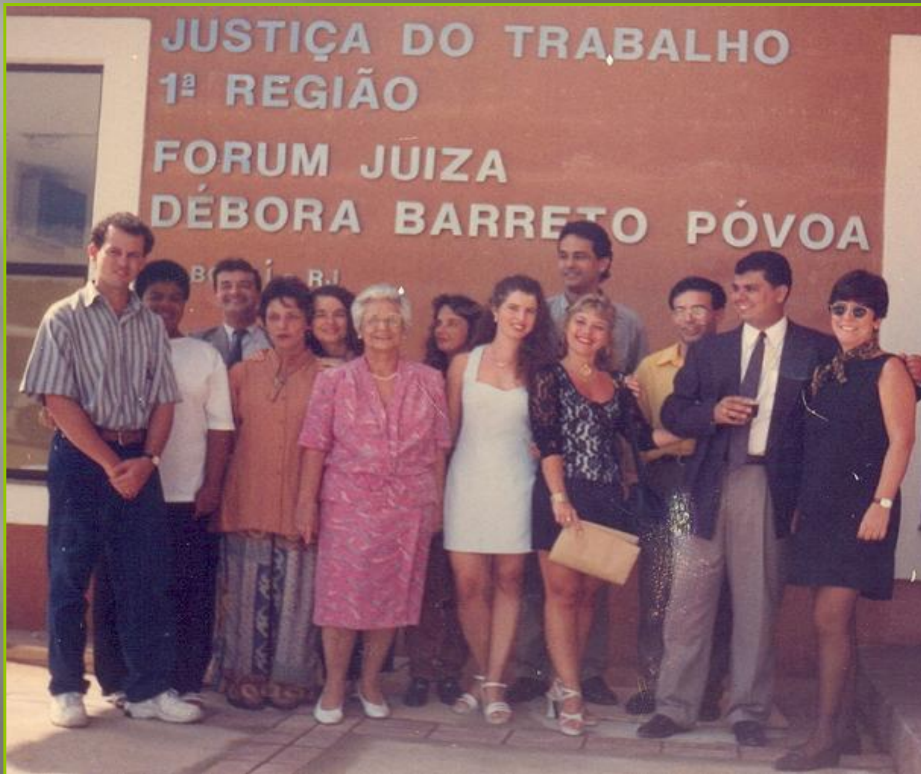
A juíza foi homenageada pelo TRT/RJ em 1989. O Fórum da JCJ de Itaboraí foi batizado com o nome da magistrada, que exerceu a titularidade da Junta por cinco anos